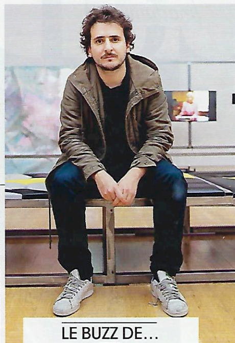
LE BUZZ DE...